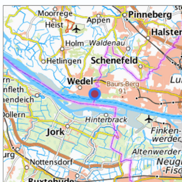
Lage in der gesuchten Region