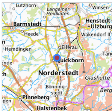
Lage in der gesuchten Region