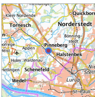
Lage in der gesuchten Region