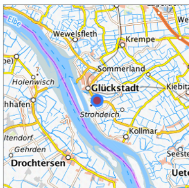
Lage in der gesuchten Region