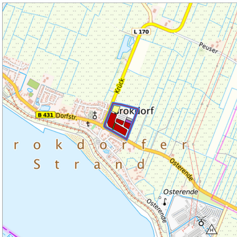
Detaildarstellung der gesuchten Gewerbefläche