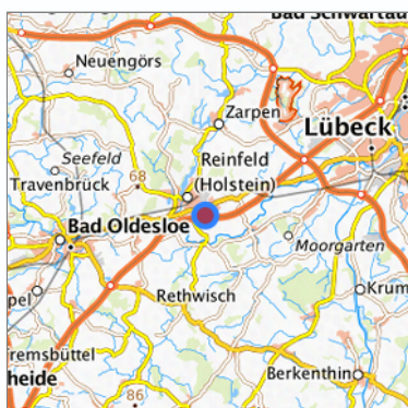
Lage in der gesuchten Region