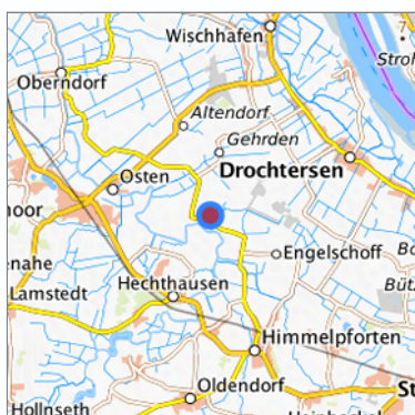
Lage in der gesuchten Region