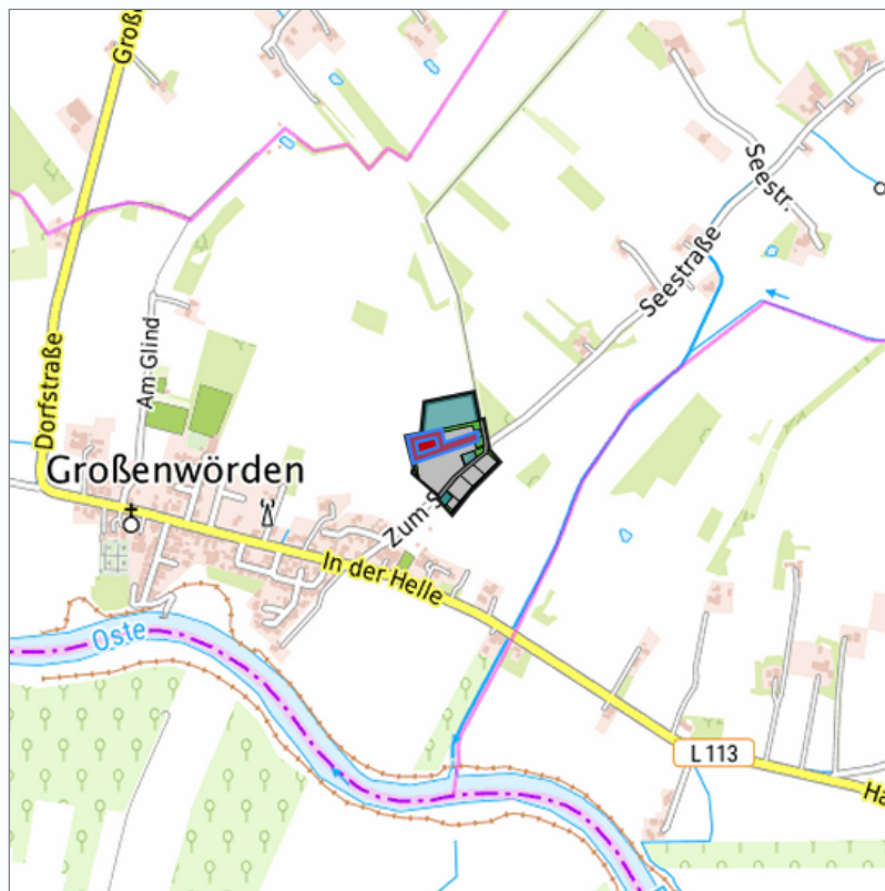
Detaildarstellung der gesuchten Gewerbefläche