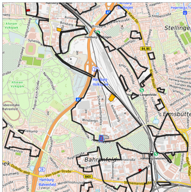
Detaildarstellung der gesuchten Gewerbefläche