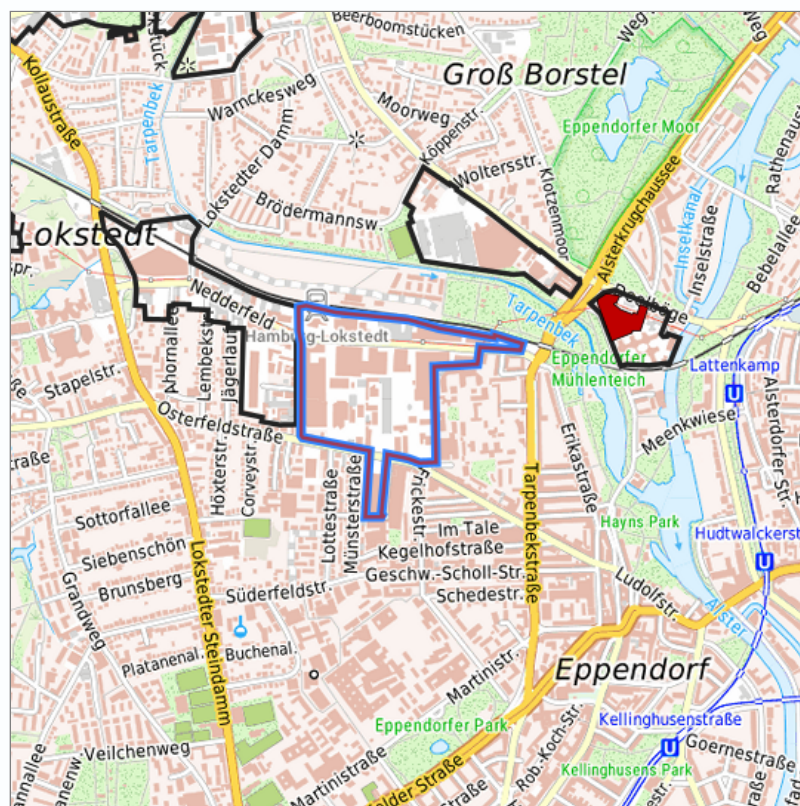
Detaildarstellung der gesuchten Gewerbefläche