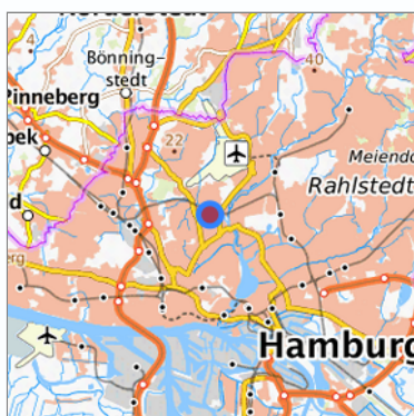
Lage in der gesuchten Region