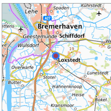
Lage in der gesuchten Region