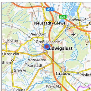
Lage in der gesuchten Region