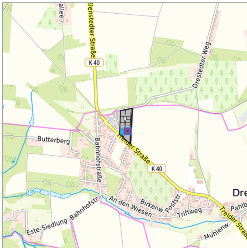
Detaildarstellung der gesuchten Gewerbefläche