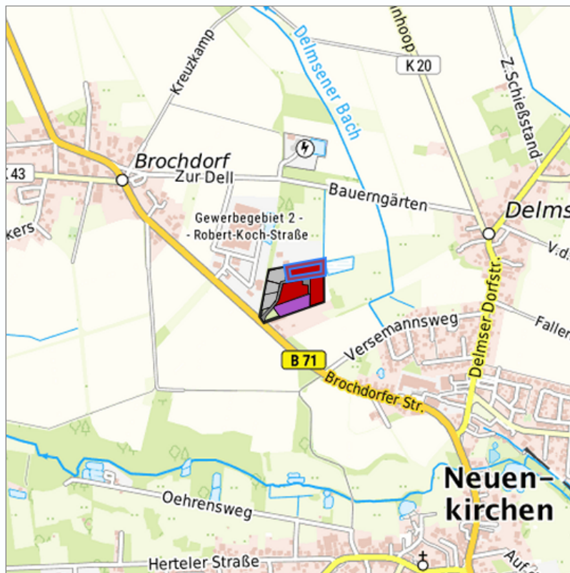
Detaildarstellung der gesuchten Gewerbefläche