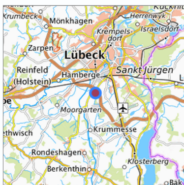
Lage in der gesuchten Region