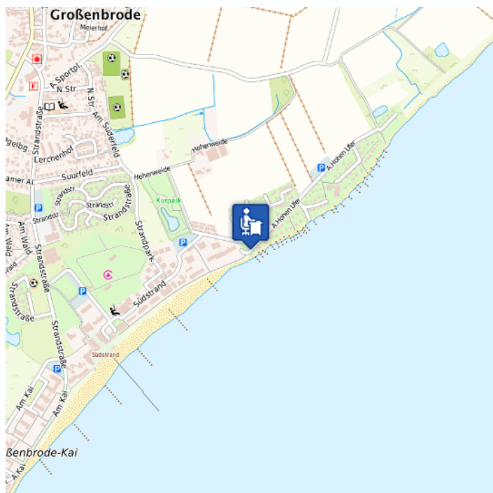
Lage des Objektes